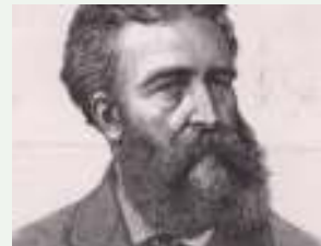
Eugène René Poubelle (1831-1907)

suivent un processus d'élimination normal, légal. Enfin, signaler en mairie (mairie@lesmesnuls.fr) ou auprès de la Communauté de Communes (accueil@ccc.fr) toute présence de déchets délictuels ou suspects. Ce n'est pas de la délation, c'est de la protection/prévention de notre espace commun.