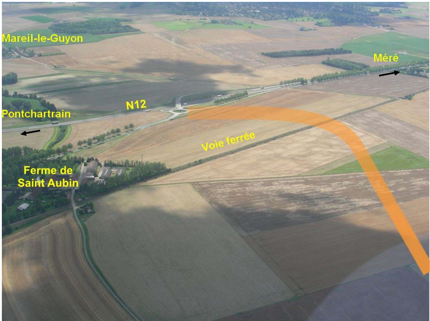
Un des « branchements » possibles du projet de liaison A13-N12 vu du ciel par JC (voir article page 4)